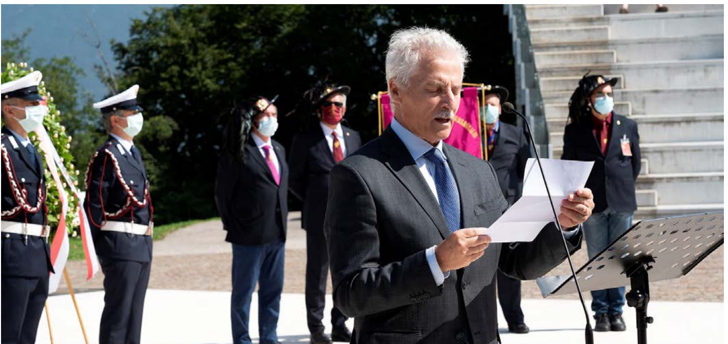
L'Ambasciatore di Malta presso l'Italia Carmel Vassallo